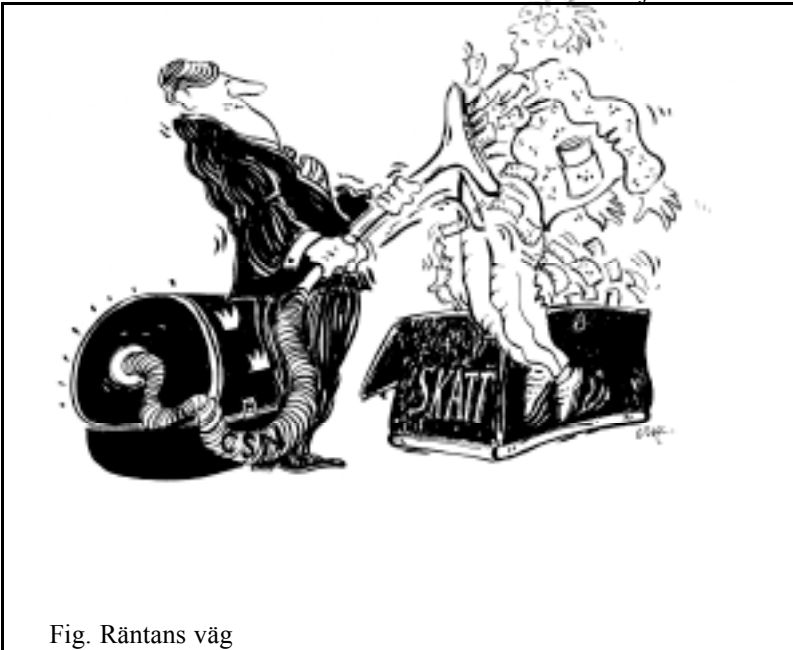
Fig. Rântans väg

Åtgärder är nödvändiga - annars skjuter man kostnaderna på framtiden. Räntesubventionerna blir större för varje år och